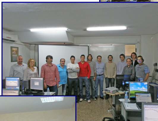
Valencia. Octubre de 2008